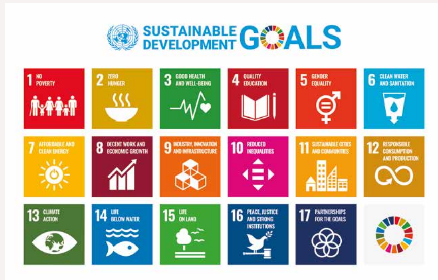
FN:s mål för hållbar utveckling

Detta löfte konkretiseras i universitetens gemensamma teser om hållbar utveckling och ansvarsfullhet som presenteras här. Över 400 av universitetssamfundets medlemmar deltog i arbetet med att redigera och kommentera teserna under UNIFIkeke-seminariet i september 2020.